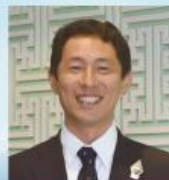
厚生労働省 保険局保険課長 山下 護